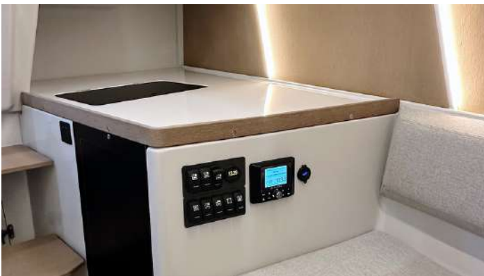
Standardversion mit Ablagefläche und Stauraum