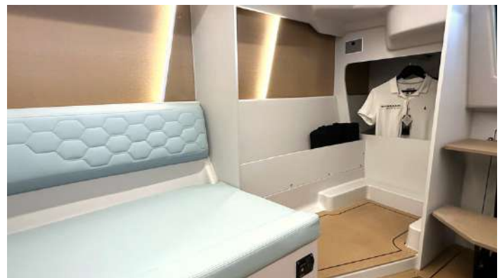
Standardversion mit Ablage und Kleiderständer.