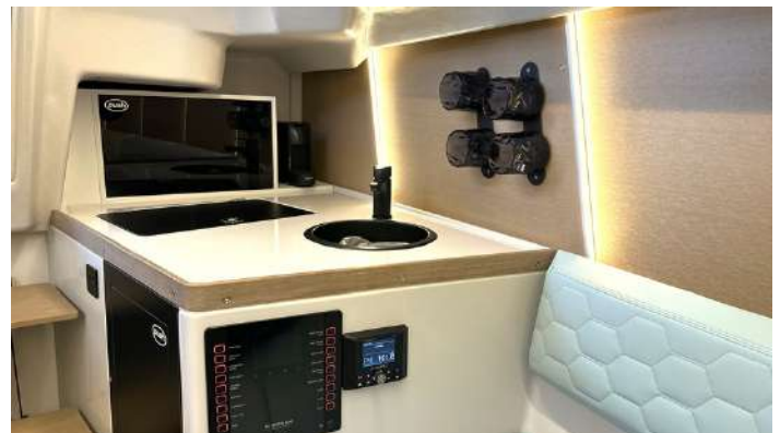
Pantry Modul mit Wassersystem, Kühlbox und zusätzlichem Stauraum*